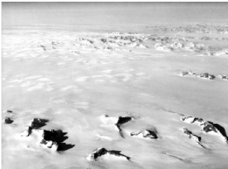
3. Kontinentální ledovec v jihovýchodní části Grónska, ležící přibližně na 62. stupni s. š. V popředí jsou vyčnívající skalní suky ( nunataky ) a v pozadí horská pásma lemující východní pobřeží Grónska.

grónský ledovec nachází zhruba v rovnovážném stavu, s malými přírůstky hmoty v akumulčních oblastech a úbytky v jižní části. Většina ostatních svě-