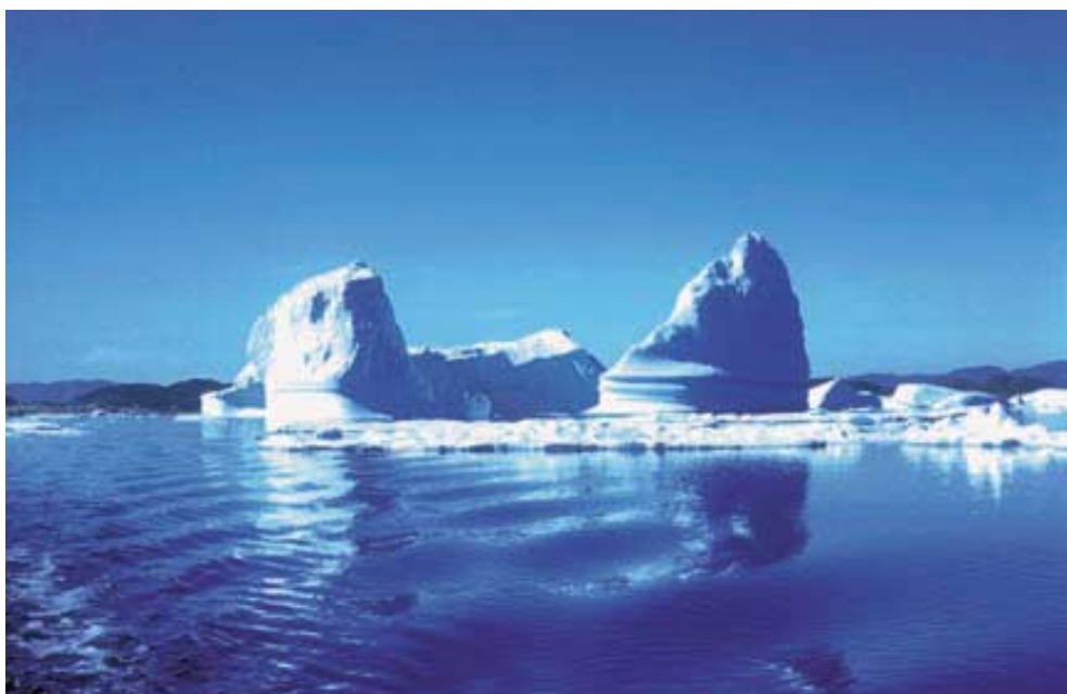
Největší kry vznikající pod splazy grónského pevninského ledovce dosahují rozměrů stovek metrů.