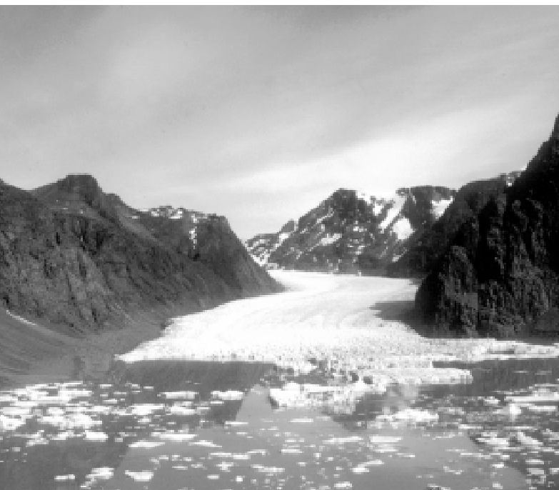
5. Ledovcový splaz v jižním Grónsku během letního období.

dovce v Patagonii a na Novém Zélandu, které naopak přibývají.