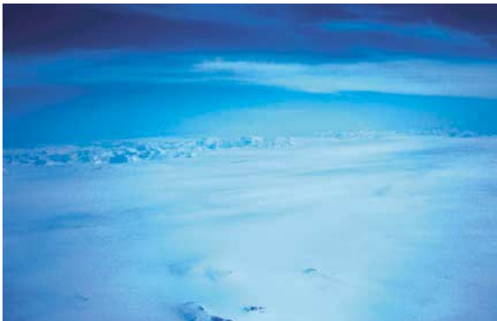
Pánev kontinentálního ledovce v jižním Grónsku lemovaná pásmem pohoří. V popředí je skupina nunataků.