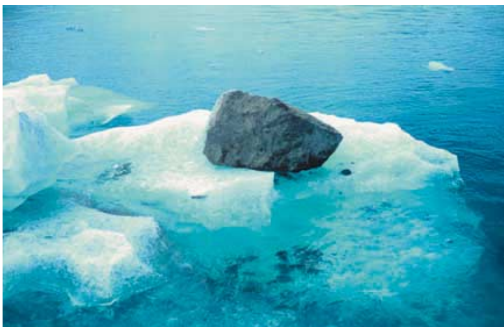
V ledových krách je velké množství úlomků hornin transportováno do oceánských pánví. Situace je dobře známa i z horninového záznamu; například v jemnozrnných horninách svrchního ordoviku Barrandienu byly nalezeny valouny žul se stopami transportu v ledu. (Nahore Narsarsuaq, uprostřed dole okolí Narsaq, jižní Grónsko)