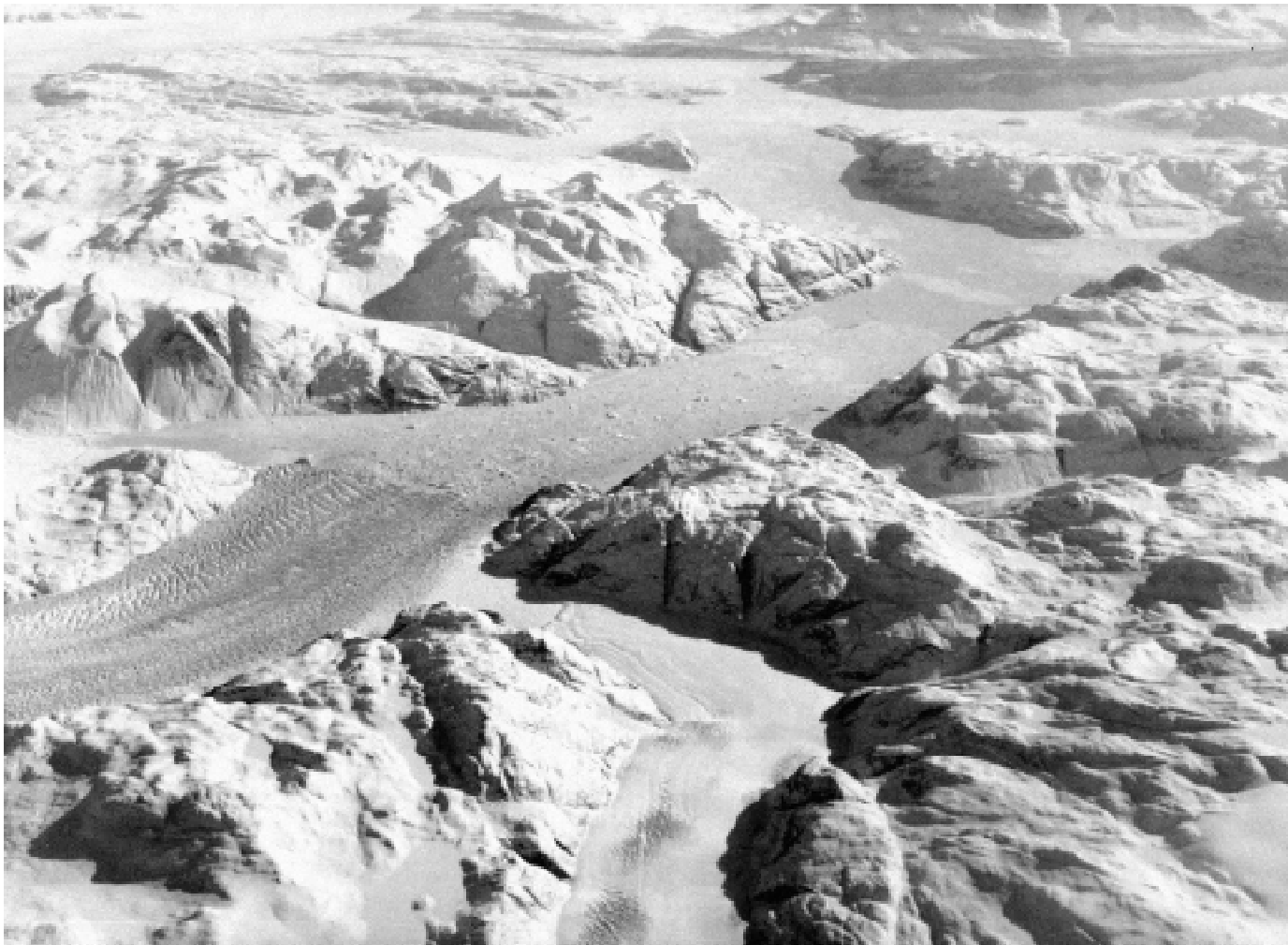
4. Tentýž ledovcový splaz z jiného pohledu. Relativně rovný terén ve střední části snímku byl v pleistocénu patrně bází pevninského ledovce, zatímco vrcholky v horní části obrázku byly nunataky.

ových ledovců, tj. antarktický ledový štít a horské ledovce všech kontinentů, vykazují naproti tomu úbytek ledové masy. Výjimkami jsou jen některé le-