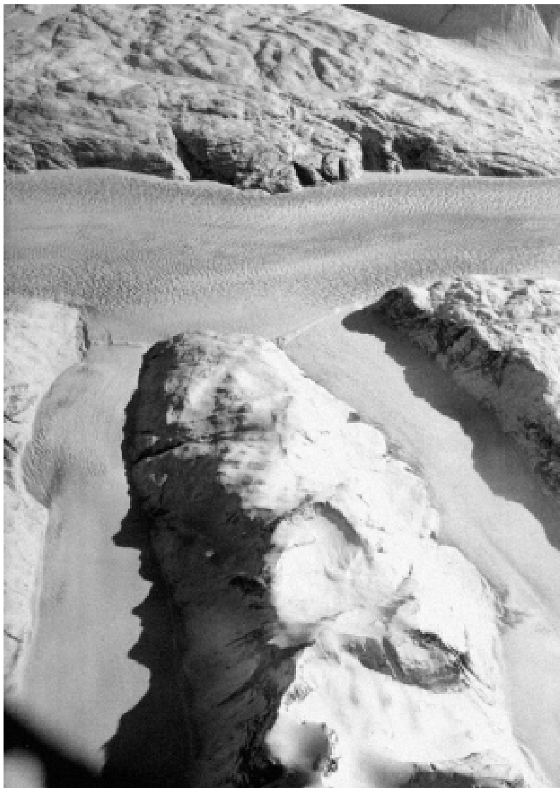
2. Dva ledovce horského typu, které se „vlévají“ do pevninského splazu (jihozápadní Grónsko, poblíž Narssalik)

Pro soudobé pozorování povrchových změn ledovce jsou nejužitečnější údaje z metod dálkového průzkumu Země, např. z družic Seasat a Geosat (viz Vesmír 77, 294, 1998). Družice zaznamenávají jak přírůstek či úbytek ledové hmoty, tak rozšíření jednotlivých sněhových typů. Nové zpracování dat získaných v minulých letech méně propracovanými technikami nabízí obstojnou představu o tom, co se nedávno dělo na povrchu ledovce. Ukazuje se, že se