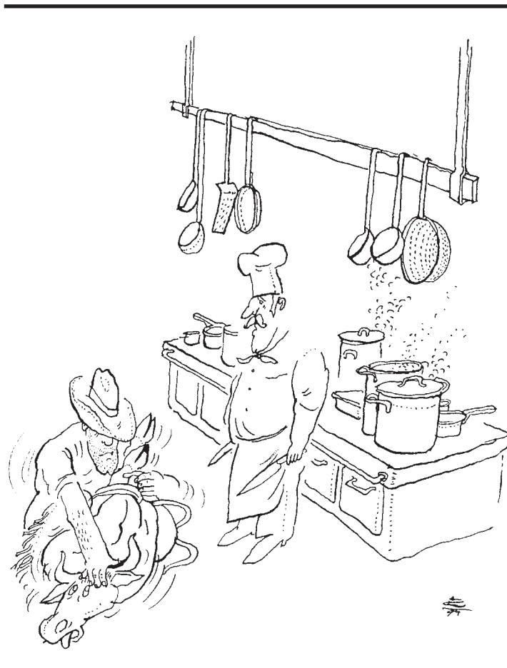
Kresba © Jan Kristofori

Dosud v Británii zemřelo na vCJD zhruba devadesát osob. Epidemiologové nemají jistotu, kolik jich ještě bude. Mohou to být i tisíce, neboť inkubační doba je přibližně deset let. Britská vláda zavádí finanční kompenzace pro postižené a jejich rodiny. Phillipsova zpráva má šestnáct svazků a obsahuje 167 poučení z událostí v letech 1986–1996. O výskytu BSE mimo Británii v ní není nic uvedeno. Situace je o to zákeřnější, že priony vyvolávající BSE jsou rezistentní na horko, a tedy se neničí vařením ani pečením.