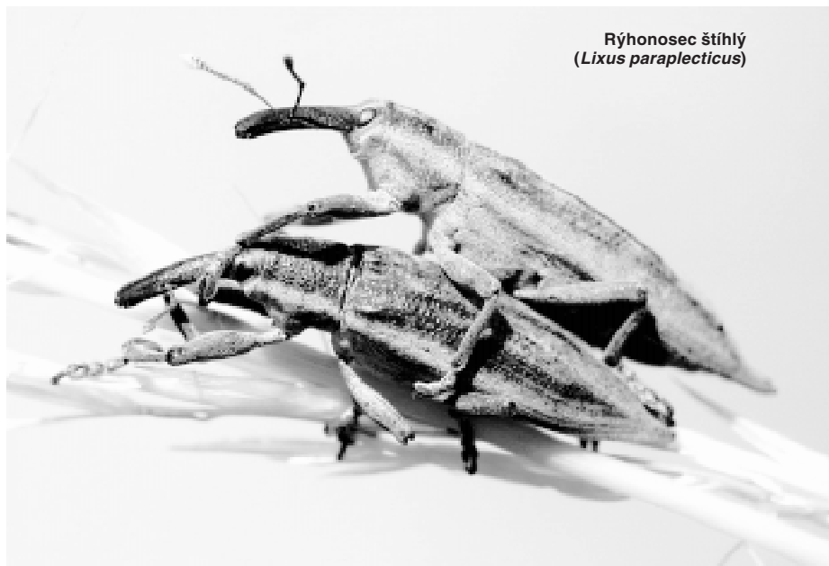
Rýhonosec štíhlý ( Lixus paraplecticus )

Radka Aixnerová ve svém příspěvku hledá odpověď na otázky č. 3 a 6. Při odpovědi na otázku č. 6 se uvádějí mechanismus (bariéra proti možnému zá-