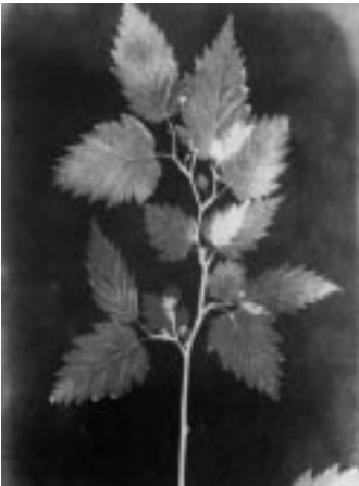
Talbotova fotogenická kresba z r. 1839

Kalotypie (talbotypie), fotogenické kresby a první negativ. Papír napuštěný kuchyňskou solí se zcitlivěl roztokem dusičnanu stříbrného. Na takový papír kladl Talbot rostliny z herbáře a vykopírovaný negativní obraz různým způsobem ustaloval (kuchyňskou solí, jodidem draselným, ferrokyanidem draselným nebo tiosíranem sodným). Výsledky Talbot označoval jako fotogenické kresby. Roku 1835 Talbot pomocí malé kamery, kterou rodina přezdívala „past na myši“, exponoval na chloridostříbrný papír okno svého sídla – tak vznikl první negativ. Později Talbot proces pozměnil: Papír napuštěný dusičnanem stříbrným vložil do roztoku jodidu draselného (vysrážel se ve vodě nerozpustný jodid stříbrný). Takto preparovaný papír se mohl usušit a nějaký čas skladovat. Před expozicí se zvlhčil roztokem dusičnanu stříbrného a kyseliny gallové. Lehee usušený, ale ještě vlhký papír se exponoval, vyvolal roztokem dusičnanu stříbrného a kyseliny gallové a ustálil tiosíranem sodným. Tento papír se voskem zprůhlednil a překopíroval stejným postupem, aby se získal pozitiv. Proces byl r. 1841 patentován jako kalotypie.