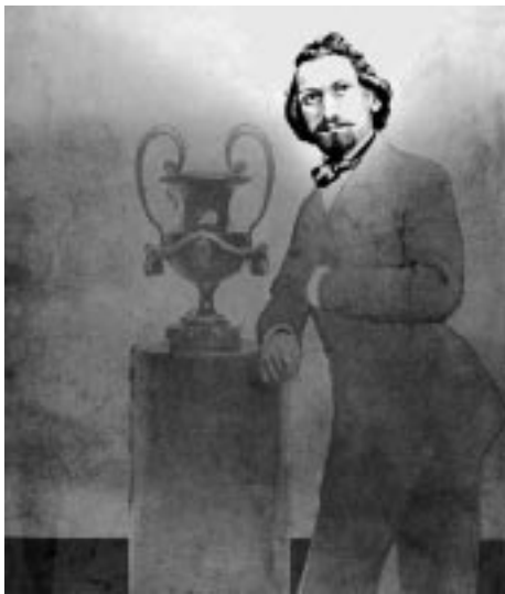
Kresba na sláném papíře, V Kramer, kolem r. 1850

Vynález fotografie nebyl ojedinělým počinem jediného muže (viz zkrácenou chronologii dějin fotografie vpravo). Rozvoj přírodních věd v 19. století – pro fotografii byly důležité fyzika (optika) a chemie – široce podnítil „vynalézavost“ a fotografie (tehdy se jí tak ještě neříkalo) spatřila světlo světa téměř současně na několika místech. Svou roli pak sehrála především dostupnost objevů, určená formou ochrany vynálezových práv. Rychlý nástup praktického použití daguerrotypie, byť šlo o „slepu vývojovou větev“, umožnila forma její prezentace – byla 19. srpna 1839 na zasedání francouzské Akademie věd a umění věnována zdarma (bez patentování) veřejnosti. Podobně i další fotografické vynálezy vznikly vícekrát, stačí připomenout barevnou fotografii, která má k dispozici více principů. I když dnes zdokonalování fotografických technik a procesů probíhá velmi sofistikovaně (třeba při konstrukci objektivů či mnohovrstvých citlivých materiálů, o elektronice ani nemluvě), vlastní „kouzlo“ při vzniku fotografického obrázku stále vysvětlují „jen“ teorie.