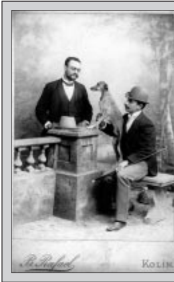
Data připravil Stanislav Vaněk ve spolupráci s Pavlem Scheuflerem, layout Pavel Hošek, © VESMÍR

Vizitka je označení jak formátu (albuminový pozitiv asi 58 × 94 mm nalepený na kartonu asi 65 × 105 mm), tak média, tj. způsobu prezentace fotografie. Je spjata s vynálezem fotoalb. Byla základem neobyčejné konjunktury fotografie zejména v letech 1859–1865; o této době hovoříme jako o „zlatém věku fotografie“. Vizitka učinila fotografii masovou záležitostí.