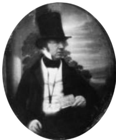
William Henry Fox Talbot