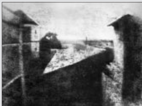
Niépeuv Pohled z okna na dvůr z r. 1826, nejstarší dochovaná fotografie

Heliografie (z řeckého helios – slunce, grafein – psát) je nejstarší způsob trvalého obrazového záznamu pomocí světla. Využívala vlastnosti přírodního asfaltu – ztvrdnutí (a v důsledku toho snížení rozpustnosti) působením světla. Po několikahodinové expozici se levandulovým olejem a petrolejem selektivně smyl obraz zastíněných míst. Nejstarší reprodukcí byla kopie rytiny papeže Pia VII., která však vzala za své již za vynálezova života.