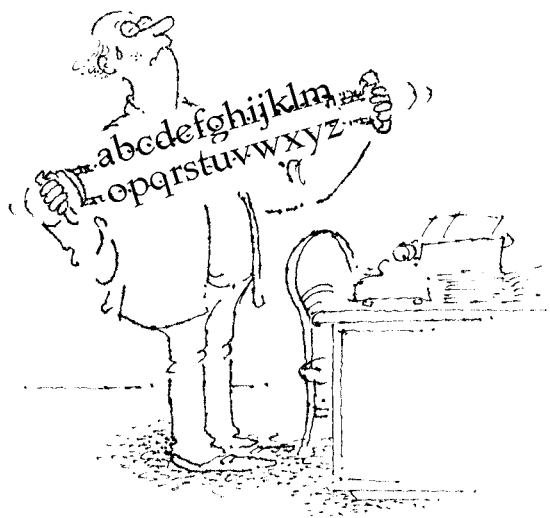
Kresba © Vladimír Renčín.

Nečekejme proto, že nějaký ústav za nás jazyk zkultivuje tak, abychom na něj mohli být